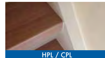
HPL / CPL

Wij werken met verschillende soorten materialen, zoals eikenhout, pvc en HPL/CPL, om je trap weer veilig, mooi en slijtvast te maken. Naast ledverlichting voor de trap hebben we ook bijpassend laminaat en trapeleuningen in rvs of (blauw)staal.